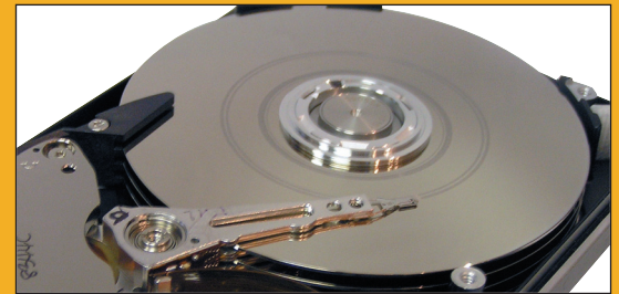
«Упавшая» на поверхность диска головка превращается в резец токарного станка, подчищающий за собой всю информацию...